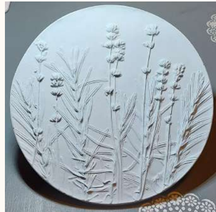
detalės: kurios pasakoja istoriją