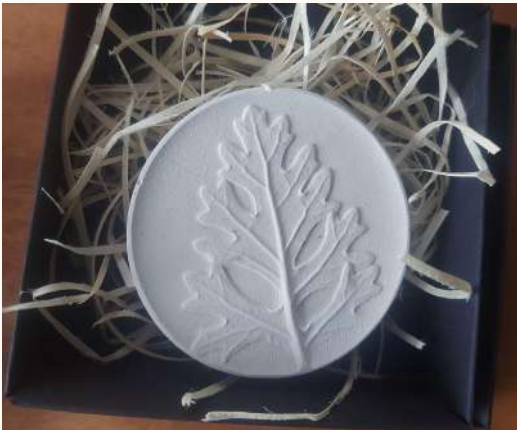
minimalizmas: balta ant balto