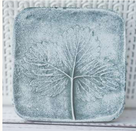
gamta: jūsų namų erdvėje