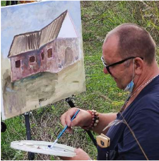
Dvarvietės kumetyno pastatą drobėje jamžina dailės plenero dalyvis 2022 m.