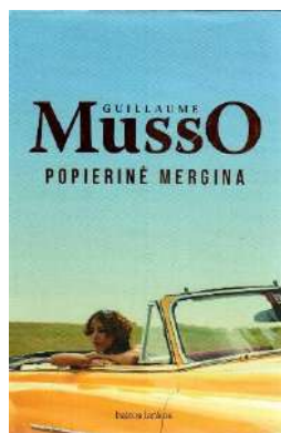
G.Musso Popierinė mergina