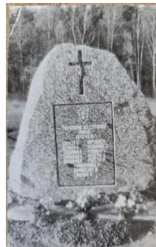
Paminklas žuvusiems partizanams Elniškiu km. Kupiškio r. 1990 m.