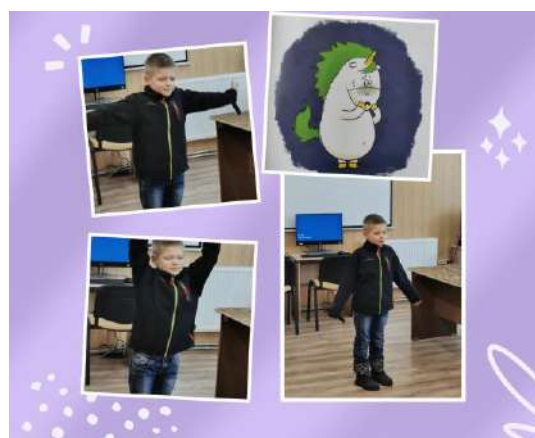
Edukacijos pagal knygą „Jausmai“.