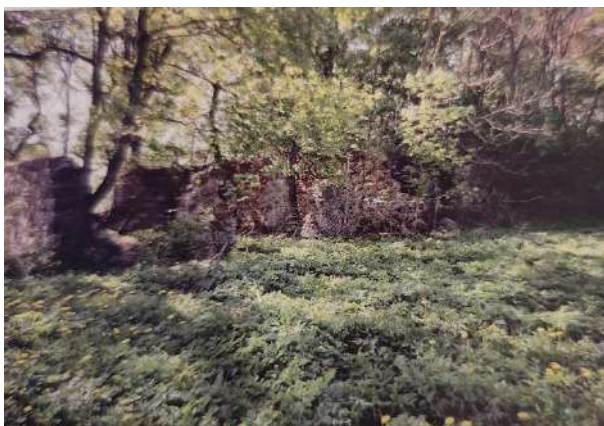
Dvaro likučiai