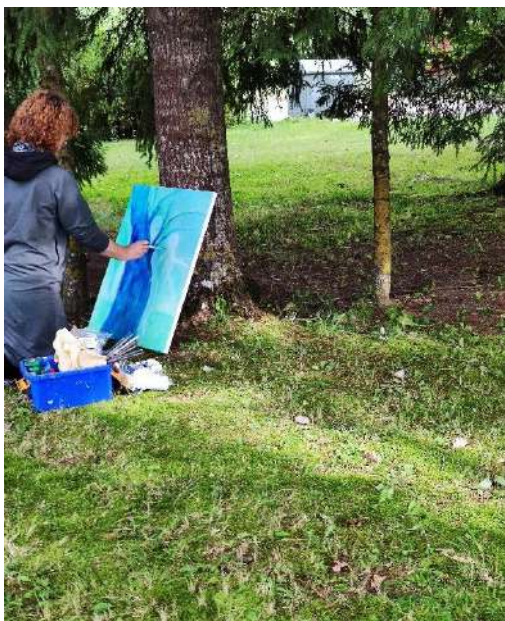
Dvarvietės kumetyno pastatą drobėje įamžina dailės plenero dalyvis 2022 m.