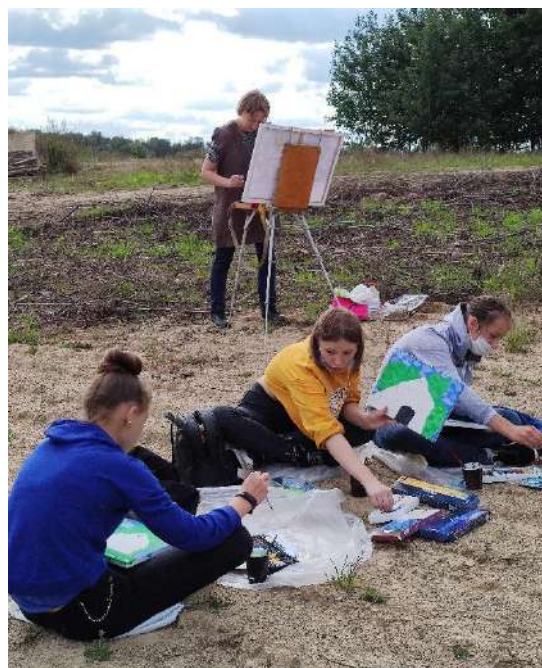
Dailės plenero dalyviai – Alizavos pagrindinės mokyklos mokiniai.