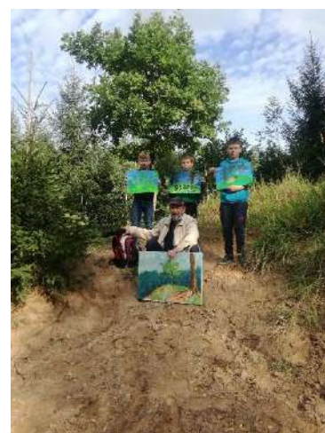
Dailės plenero dalyviai ant Dijokalnio 2022 m.