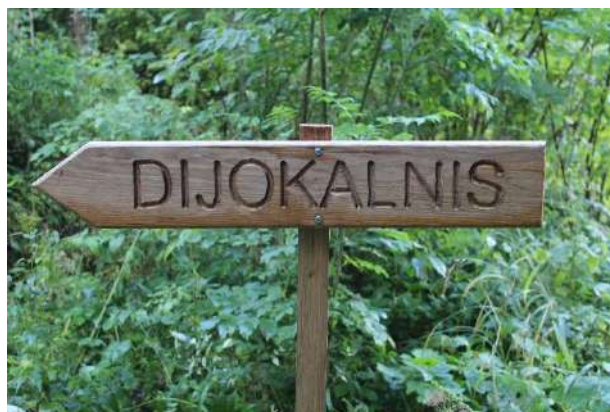
Alizavos mokinių daryta lentelė.