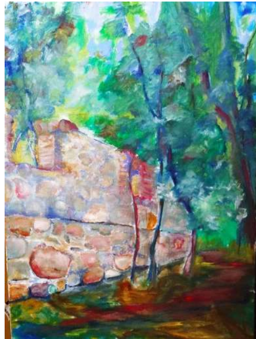
Rytinės dvarvietės sienos piešinys drobėje. Dailės pleneras Alizavoje 2022 m.