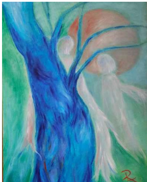
Dailės plenero metu drobėje įamžintas Alizavos qžuolas