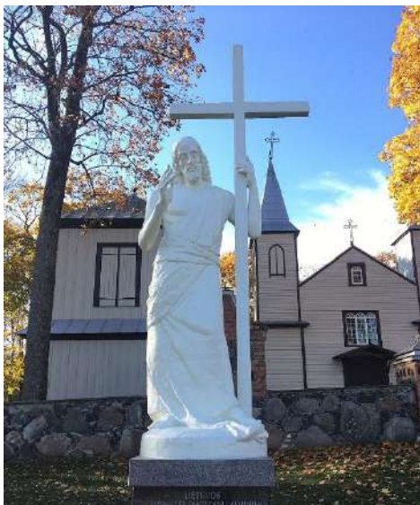
Paminklas, kurio fundatorius J. Jankauskas.

1945 m. gegužės 5 d. Karo tribunolo nuteistas sušaudyti , tačiau mirties bausmė buvo pakeista 20 metų lagerio ir 5 metais tremties .