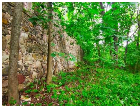
Rytinė dvarvietės siena.