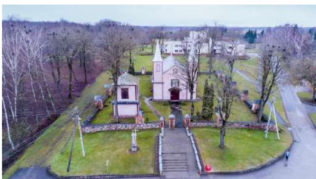
Alizavos Šv. Jono Krikštytojo bažnyčia