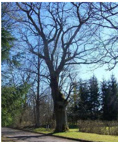
Alizavos ąžuolas.