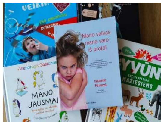
D. Pleskevičienės verstos knygos