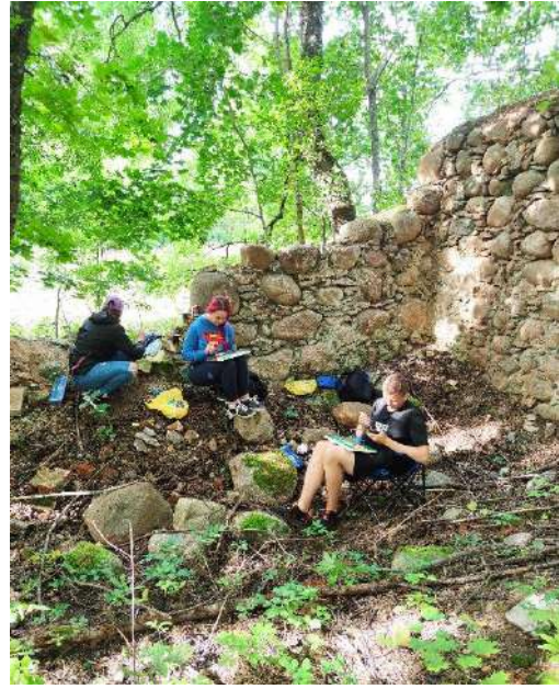
Dailės plenero dalyviai – Alizavos pagrindinės mokyklos mokiniai.