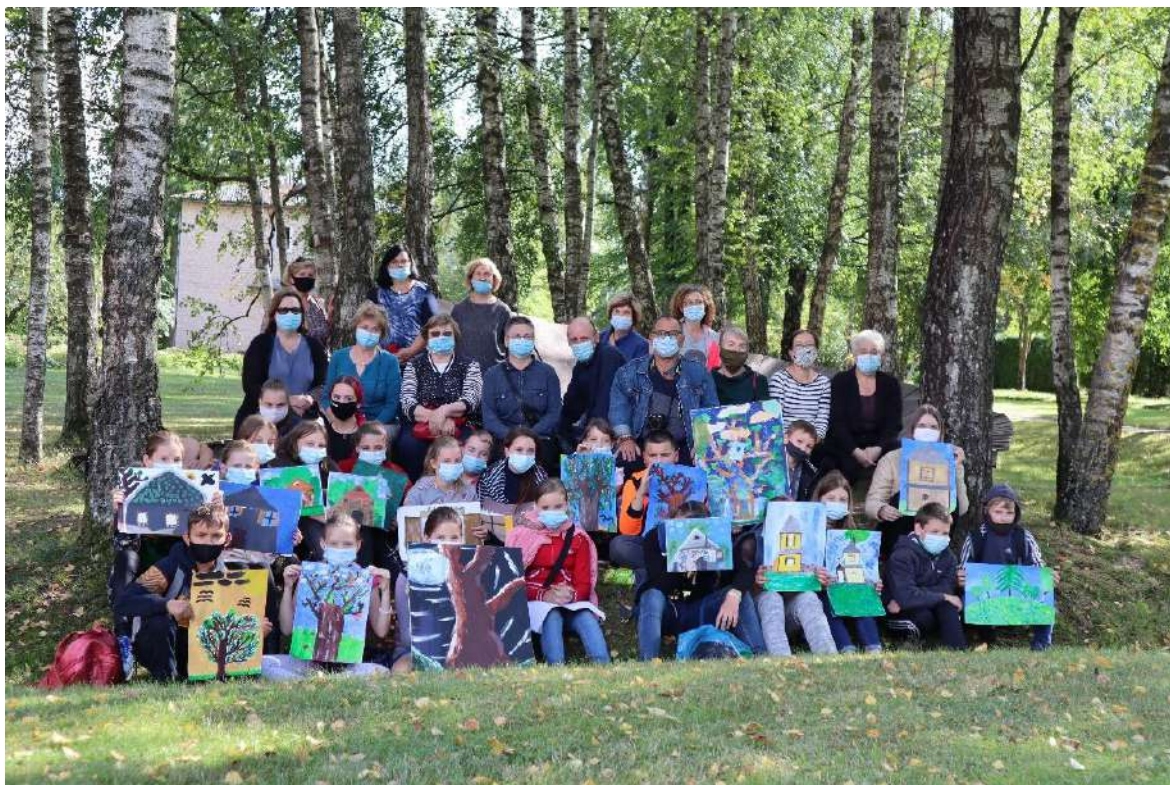
Dailės plenero dalyviai 2022 m.