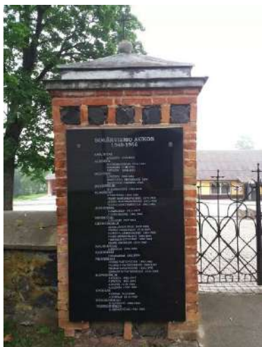
Bolševizmo aukos