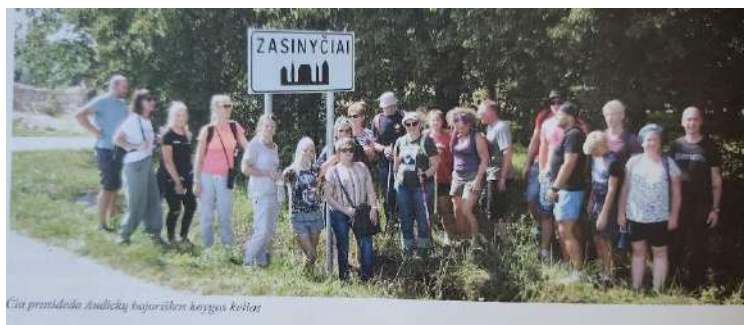
Čia pradedama Audickų bajoriškos knygos kelias