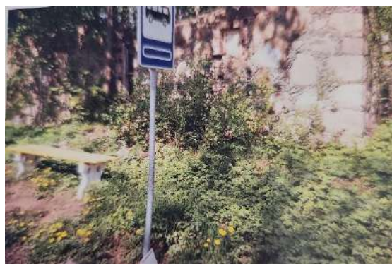
Kalėjimo likučiai..