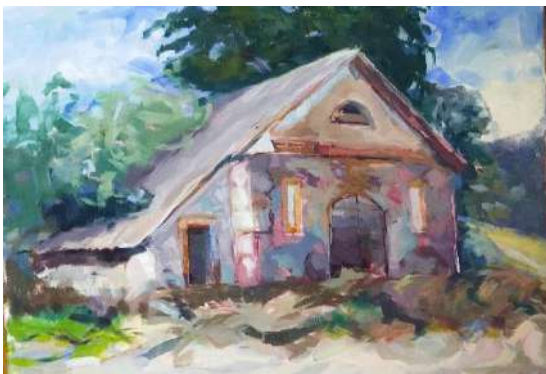
Kumetyno pastatas jamžintas drobėje dailės plenero metu. 2022 m.