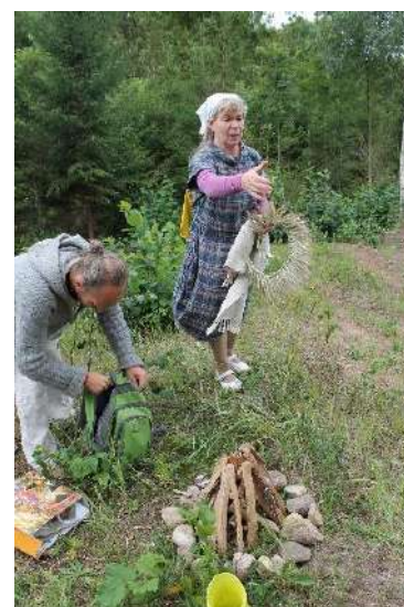
Sakralinės apeigos Dijokalnyje.