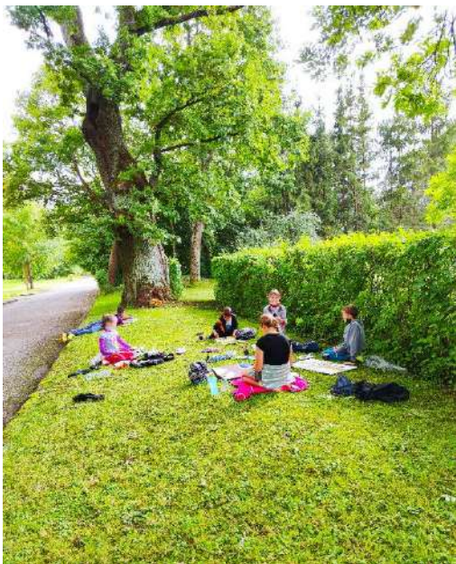
Prie Alizavos qžuolo, dailės plenero metu, 2022 m.