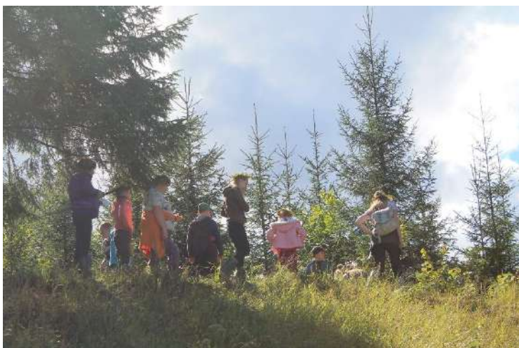
Alizavos bendruomenės nariai.