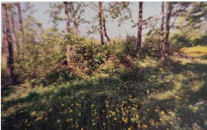
Samaritautos kapas turėjo būti šioje vietoje.

Legendose minima ir nugrimzdusi bažnyčia, velnyčia , bei Samaritautos kapas – piktos karalaitės kapavietė. Sakoma, kad šiose vietose iki šiol vaidenasi.