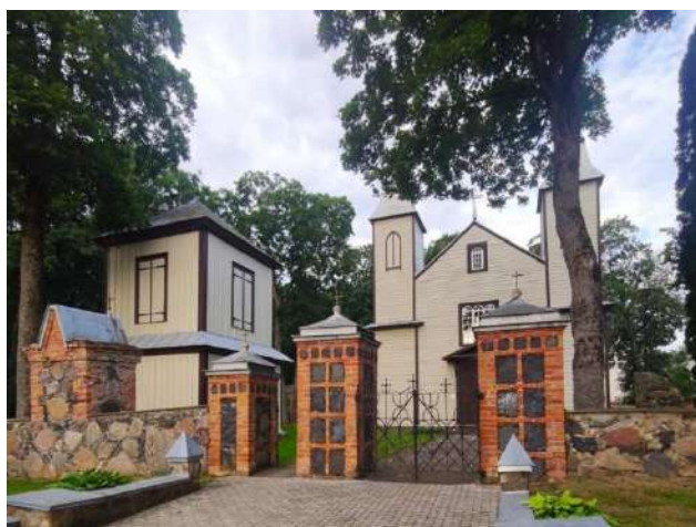
Alizavos Šv. Jono Krikštytojo bažnyčia.