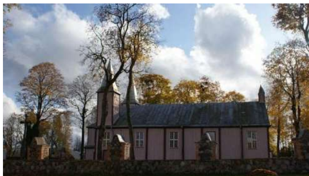
Alizavos bažnyčia iš profilio.