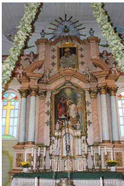
Alizavos bažnyčios interjeras