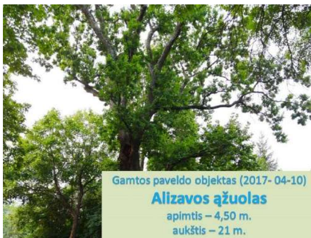
Alizavos ąžuolas.

Alizavos ąžuolas – įspūdingo dydžio senovinis medis, saugomas kaip valstybės saugomas botaninis gamtos paveldo objektas . Jis auga Alizavos miestelyje, Kupiškio rajone , netoli Bajorupio upelio , ir traukia lankytojus savo išskirtiniais matmenimis bei istorine verte.