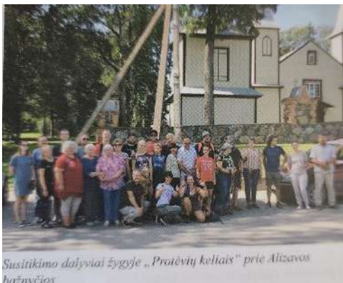
Susitikimo dalyviai žygyje „Protėvų keltais“ prie Altvavos bažnyčios