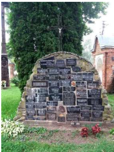
Sovietmečio aukos, nuotr. Danutės Miknevičienės