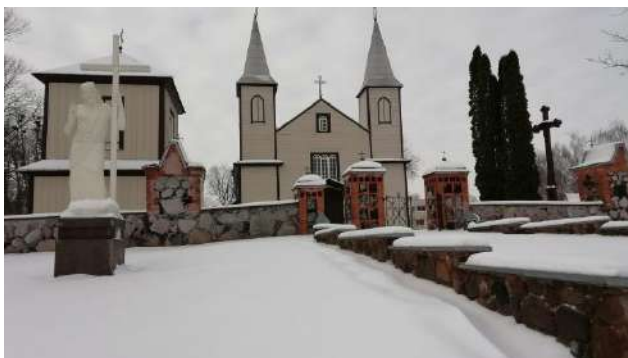
Alizavos Šv. Jono Krikštytojo bažnyčia.