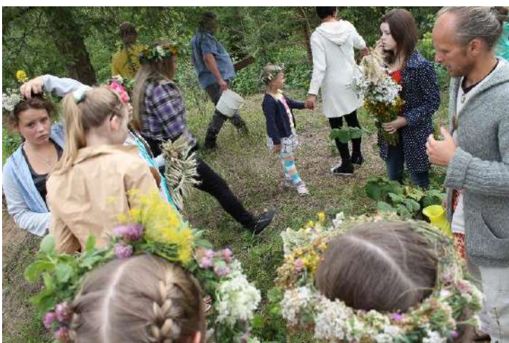
Mitologinės apeigos Dijokalnyje.