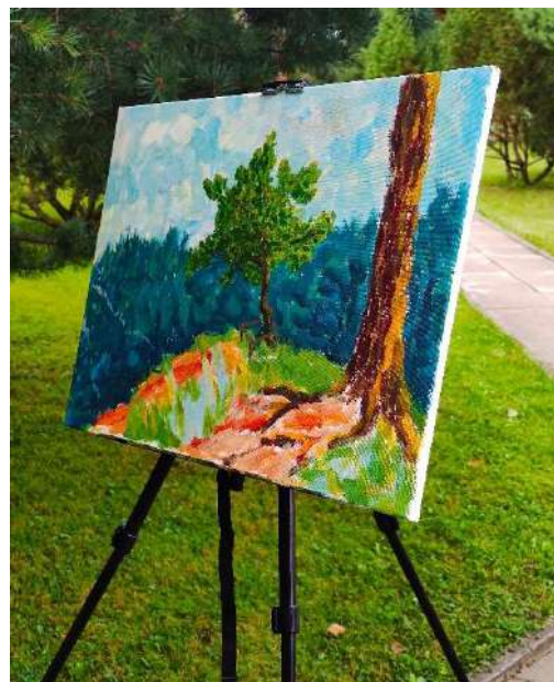
Dailės plenero metu drobėje pavaizduotas Dijokalnis.