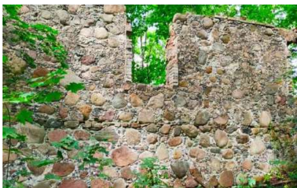
Gyvenamojo namo liekanos.