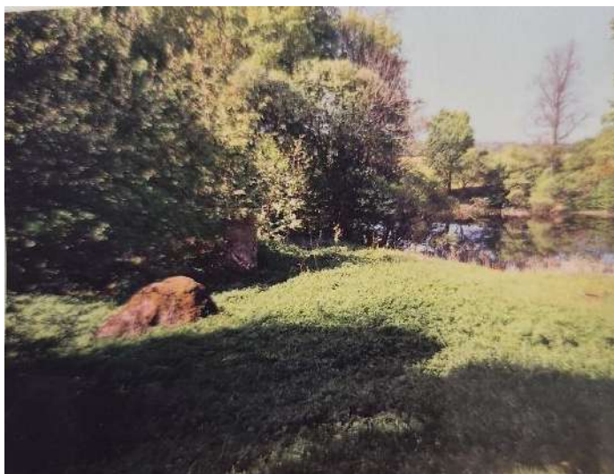
Vandens malūno vieta.

Pasakojama, kad dvare veikė vandens malūnas , o dvaro sode buvęs didelis obuolynas.