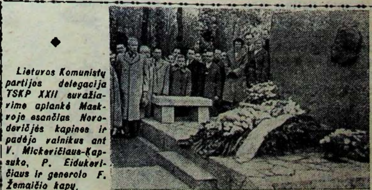
Lietuvos Komunistų partijos delegacija TSKP XXII suvažiavime aplankė Maskvoje esančias Novodėvičės kapines ir padėjo vainikus ant V. Mickovičiaus-Kapsuko, P. Eidukovičiaus ir generolo F. Žemaitio kapų.

Iš šio plenumo mes visi turime padaryti rimtas išvadas. Yra visos galimybės pasiekti žymiai geresnių rezultatų, išbristi iš atsilikimo. Ir mes privalome tai padaryti, nes to iš mūsų reikalauja TSKP XXII suvažiavimo nutarimai, naujoji partijos Programą.