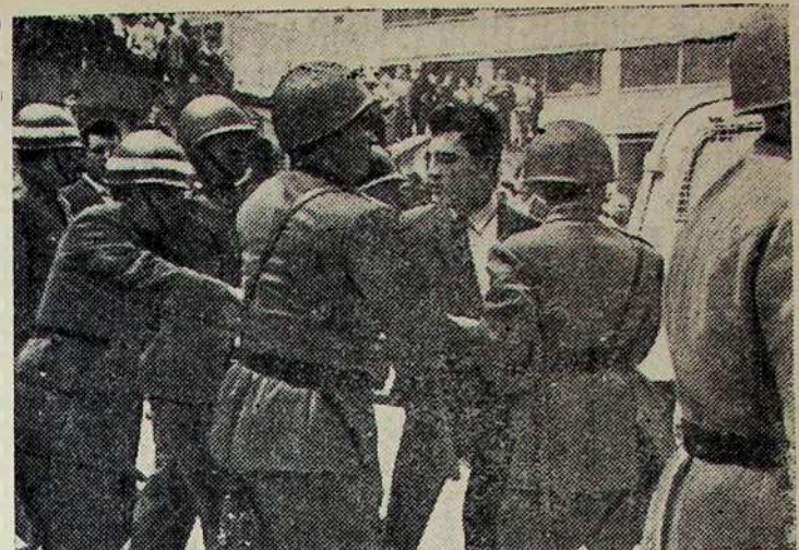
KOLUMBIJA. Šalties sostinėje Bogotoje įvyko bankų tarnautojų streikas. Bankų darbuotojai pareikalavo pagerinti darbo sąlygas. Vyriausybė streiką pripažino neteislingu. Policija užpuolė streikuojančiuosius. Areštuota visa eilė profesinių sąjungų vadovų. Nuotraukoje: streikuojančiojo areštas.

šijamos mažmeninės prekių apyvartos užduotys. Kooperatyvo vadovai žino, jog šioje parduotuvėje niekada nesugenda prekės, nebūna ir trūkumų. Kalbėsi su komjaunuole Blažyte ir nejučiom ją žaviesi. Apie save Sofija nenoriai pasakoja. Su užsidegimu ji kalba apie šviesią komunistinę ateitį, kurios statybai ji atiduoda visas savo jėgas. («Kooperatininkas»)