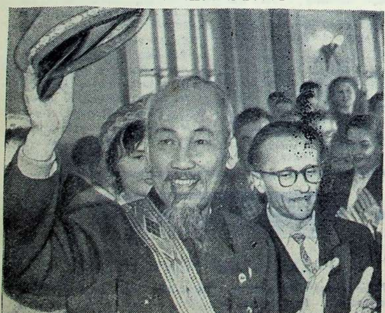
Viešėdami Tarybų Lietuvos sostinėje, Vietnamo Darbo žmonių partijos Centro Komiteto pir-