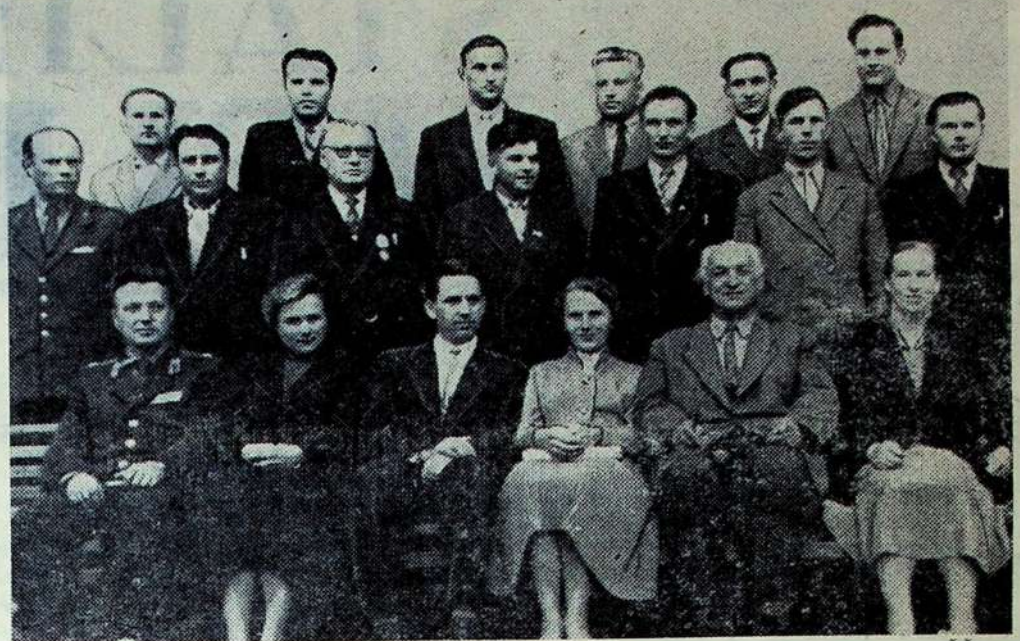
NUOTRAUKOJE: RAJONO PIRMOSIOS PARTINĖS KONFERENCIJOS DALYVIŲ GRUPĖ. PIRMOJE EILĖJE ANTRAS IS DEŠINĖS — LIE- TUVOS TSR AUKŠČIAUSIOS TARYBOS PREZIDIUMO PIRMININKAS JUSTAS PALECKIS.