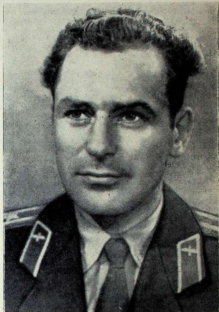
1961 metų rugpjūčio 6 kosmonautas majoras dieną 9 valandą Maskvos draugas Germanas Stepanovičius Titovas. Nuovėl buvo paleistas į Žemės orbitą naujasis kosmonautas majoras Germanas Stepanovičius Titovs. Laivą „Vostok-2“ pilotavo Tarybų Sąjungos pilietis lakūnas

TSKP TSRS TSRS CENTRO AUKŠČIAUSIOSIOS MINISTRŲ KOMITETAS TARYBOS TARYBA PREZIDIUMAS