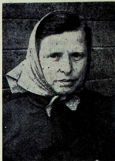
sidojo. Neveltui ją kolūkiečiai vadina auksinių rankų žmogumi.

Ji savo žodžius patvirtina. Kokio tik darbo imasi, su kiekvienu su-