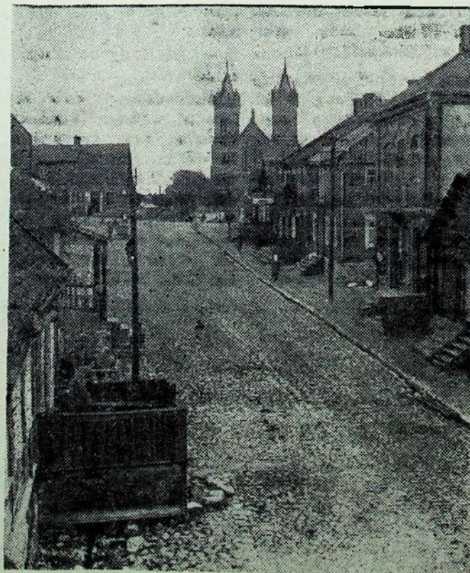
KUPIŠKIS, GEDIMINO g-vė (1935 m. nuotr.).