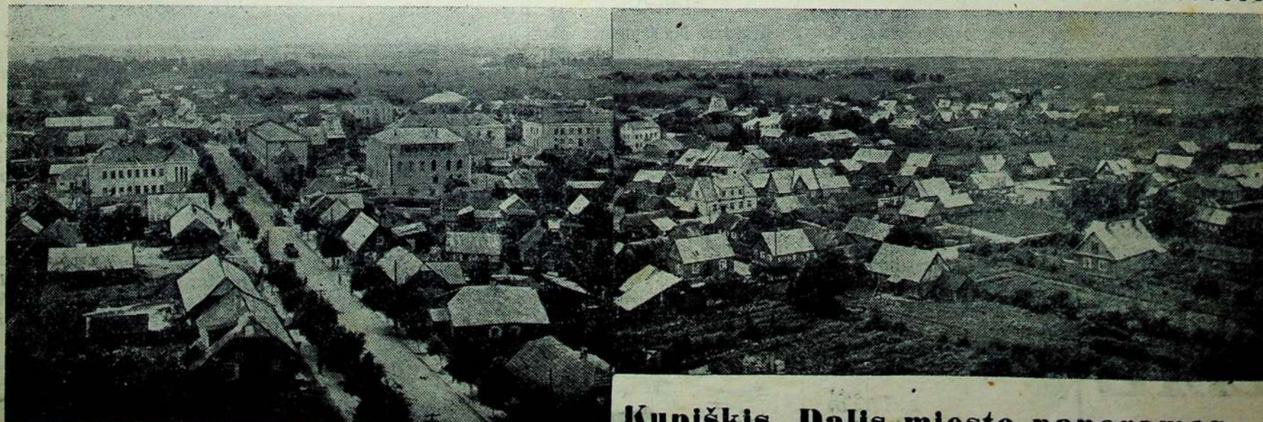
Kupiškis. Dalis miesto panoramos.