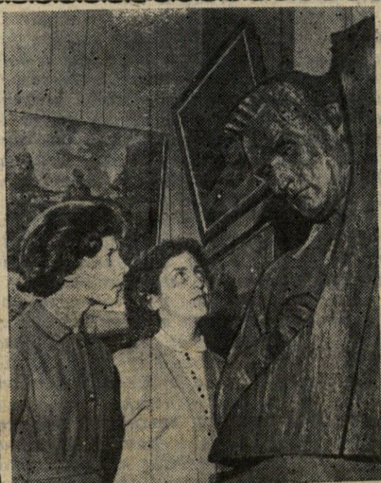
Vilniaus kraštotyros muziejuje buvo atidaryta respublikinė liaudies meno paroda, skirta Tarybų Lietuvos dvidešimtmėčiui. Parodoje beveik aštuoni šimtai liaudies menininkų eksponavo apie du tūkstančius darbų — paveikslų, medžio drožinių, keramikos dirbinių, audinių. Nuotraukoje: lankytojai liaudies meno parodoje.