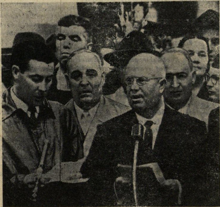
NIUJORKAS. N. Chruščiovas kalba Tarybų Sąjungos, Amerikos ir kitiems užsienio laikraščių, radijo ir televizijos korespondentams. Iš dešinės į kairę: draugai Todoras Živkovas, N. S. Chruščiovas ir G. Georgiu-Dežu.

...Mums tenka gyventi andringiausiu, bet užtat puikiausiu žmonijos vystymosi laiku, ir ateities žmonės mums pavydės.