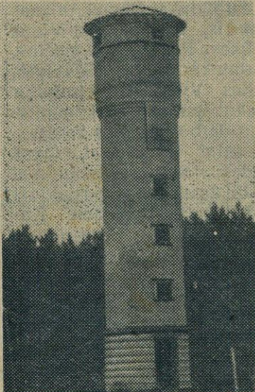
Tai — vandentiekio bokštas. Greitu laiku gyvenvietės dirbantieji galės naudotis vandentiekio, veiks kanalizacija.