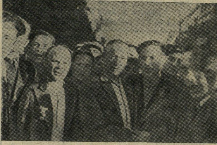
Kauno darbo žmonės sutinka politinius kalinius, išėmusius iš kalėjimo 1940 metų birželio mėnesį.