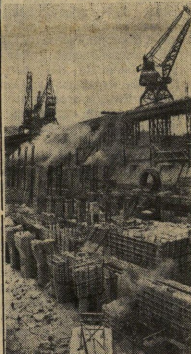
RYTŲ KAZACHSTANO SRITIS. Buch-tarmino hidromazgo statyboje prasidėjo lemiamas laikotarpis. Trečiame šių metų ketvirtyje HES turi duoti pramoninę srovę. Nuotraukoje: HES statybos vaizdas.