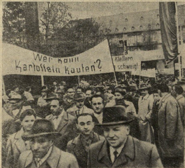
Vokietijos Federatyvinės Respublikos gyventojai protestuoja prieš besitęsiantį maisto produktų kainų kilimą ir gyvenimo lygio smukimą. Nuotraukoje: demonstracija Maince. Plakate rašoma: „Kas gali pirkti bulves?“