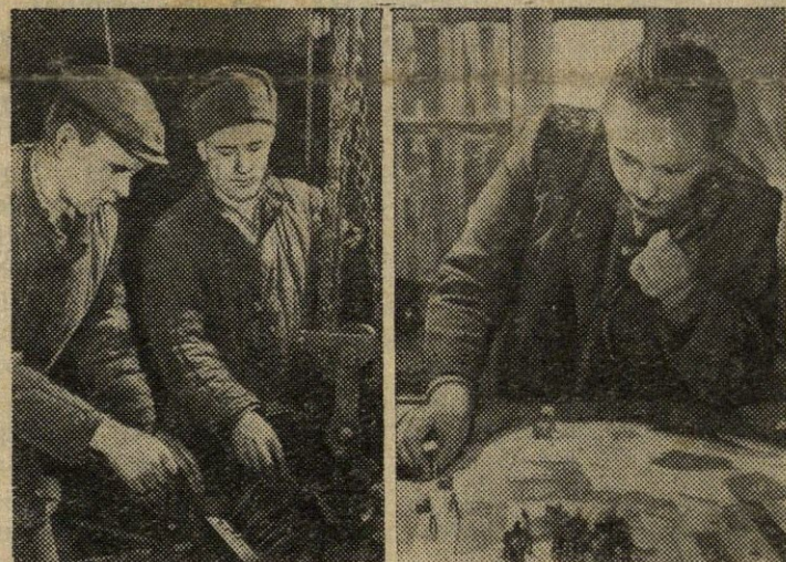
STALINGRADO SRITIS. Kolūkio „Deminskij“ (Novo-Anensko rajonas) mašinų parke yra 75 traktoriai, 50 kombainų, 60 automašinų ir daug kitos technikos, pirkto iš valstybės. Kolūkis turi gerai įrengtas dirbtuves su mechaniniu, šlifavimo, remonto ir surinkimo cechais. Mechanizatorių brigadoms vadovaujama iš dispečerinio punkto radijo ryšio pagalba.

Mūsų kolektyvas siekia, kad kuo daugiau būtų pagaminama elektros energijos, kad dar geriau būtų aptarnaujami darbo žmonės. Tačiau trūkumų vis dar pasitaiko, kurių mes vieni, be kitų įstaigų bei organizacijų pagalbos, nepajėgiame pašalinti. Didžiausias trūkumas yra tas, kad neturime pakankamai elektros laidų, nuo ko žymi dalis elektros energijos nueina veltui, per silpną srovę pasiekia toliau nuo elektrinės gyvenančius darbo žmones. Generatoriaus gamina- mos srovės įtampa yra 300 voltų. Ties ligoninė ji jau sumažėja iki 200 voltų, prie