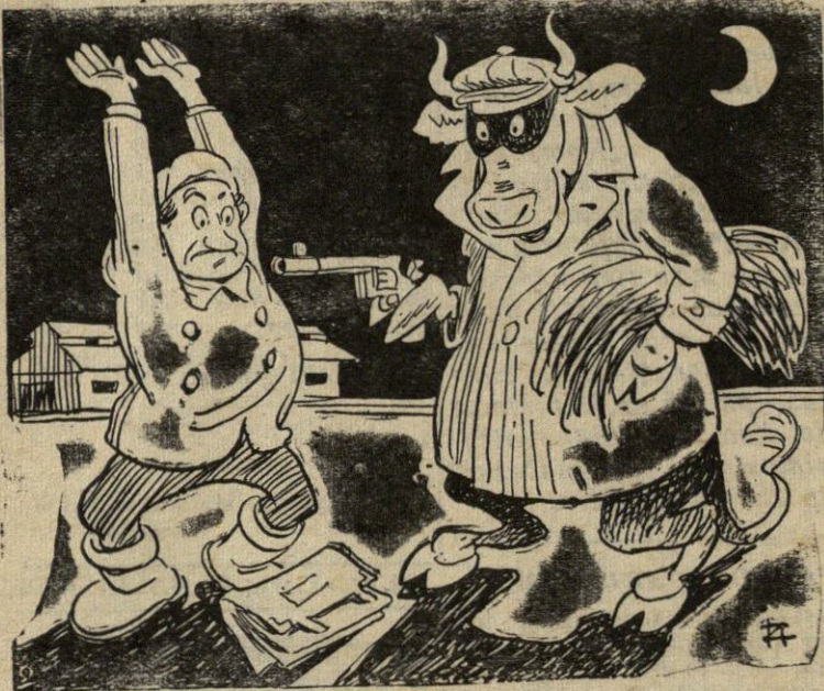
Visuomeninė karvė pirmininkui Leonui Blotniui: — Gyvybė... arba silosas!!!