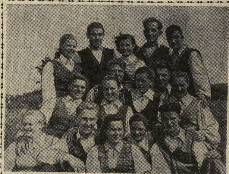
Ir lauko darbininkai, ir melžėjos, ir mokytojai — visi dalyvauja „Juodpėnų“ kolūkio meno saviveiklos rateliuose. Nuotraukoje matome jaunuosius kolūkio saviveiklininkus.