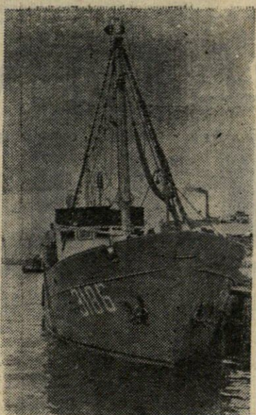
Baltijos laivų statykloje pastatytas eksperimentinis žvejybinis traleris „Neringa“ jau išplaukė į pirmąjį reisą į Šiaurės jūrą. Tai pirmas tokio tipo laivas šalyje. Jis skirtas naujoms žuiklės priemonėms bei naujiems žuvies laikymo ir transportavimo metodams išbandyti. Nuotraukoje: eksperimentinis traleris „Neringa“ Klaipėdos žvejų uoste prieš išplaukiant į pirmąjį reisą.

Lietuvių tautos laimėjimai būtų neįmanomi be draugiškos visų tarybinių tautų paramos. Neišardoma broliška tarybinių tautų draugystė ir jų savitarpio bendradarbiavimas, išmintingas Tarybų Sąjungos Komunistų partijos vadovavimas yra viso tolimosnio lietuvių tautos žengimo į priekį laidas.