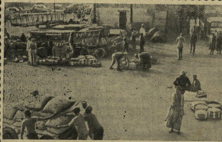
VAKARŲ AFRIKA. Senegalas. Krovējai - negrai Dakaro uoste.