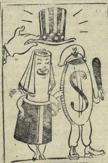
Santuoka pagal išskaičiavimą. J. Fedorovo pieš.