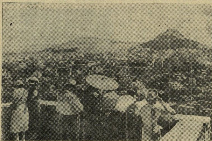
Didelė tarybinių turistų grupė motorlaiviu „Pobieda“ apke- liavo aplink Europą. Turistai praplaukė aštuonias jūras, At- lanto vandenyną, aplankė Bulgariją, Graikiją, Italiją, Pran- cūziją, Olandiją ir Švediją, susipažino su įvairių tautų gy- venimu ir buitimi. N u o t r a u k o j e: tarybiniai turistai iš Akropolio gėrisi Atėnų miesto vaizdu.