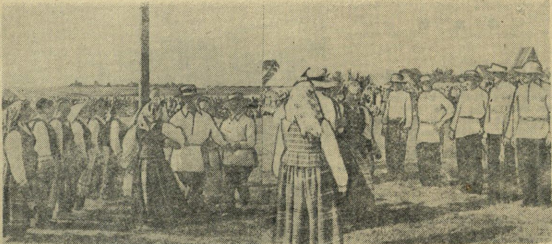
Nuotraukoje: „Aušros“ kolūkio senių šokių ratelis atlieka senobinį kupiškėnų kadrilį.