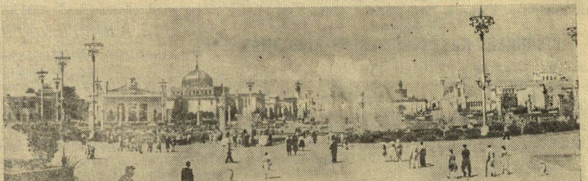
Maskvoje atsidarė 1956 metų Visasąjunginė žemės ūkio paroda ir joje išsidėsčiusi Visasąjunginė pramonės paroda. Nuotraukoje: Kolūkių aikštėje.