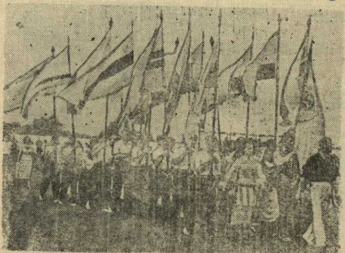
Nuotraukoje: dainų šventės dalyvių eiseną, iškilingai aidint maršo garsams, perėjusi per miesto gatves, atvyksta į stadioną.

Š. m. birželio mėn. 24 dieną miesto stadione vyko VII-oji tradicinė dainų šventė, kurioje dalyvavo daugiau kaip 1200 dainininkų bei šokėjų, jų tarpe vyrų, moterų ir vaikų chorai, 13 lietuvių liaudies žokių ratalių ir „Aušros“ kolūkio senųjų šokėjų ratalis. Stadioną užpildė penkiatūkstantinė žiūrovų minia. Čia atvyko kolūkių ir miesto dirbantieji, svečiai iš Vilniaus ir kaimyninių rajonų.