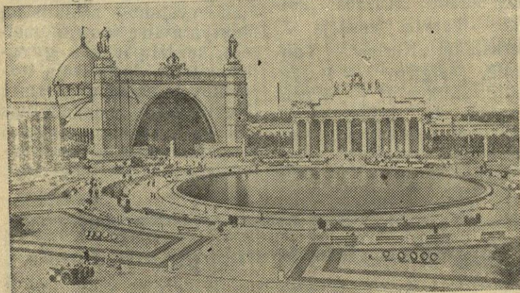
Maskva. 1956 m. Visasąjunginė pramonės paroda. Nuotraukoje: Mechanizacijos aikštė.