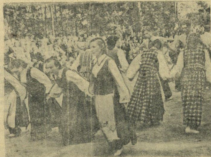
Nuotraukoje: „Aukštaičių“ kolūkio šokių kolektyvas šoka lietuvių liaudies šokį „Gyvatarą“.