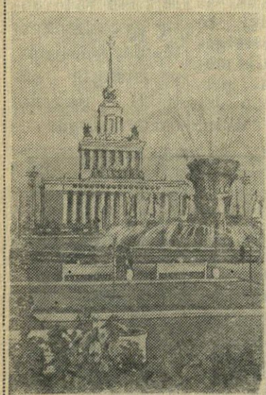
MASKVA. 1956 metų Visasąjunginė žemės ūkio paroda. Nuotraukoje: „Tautų draugystės“ fontanas ir Svarbiausias paviljonas.