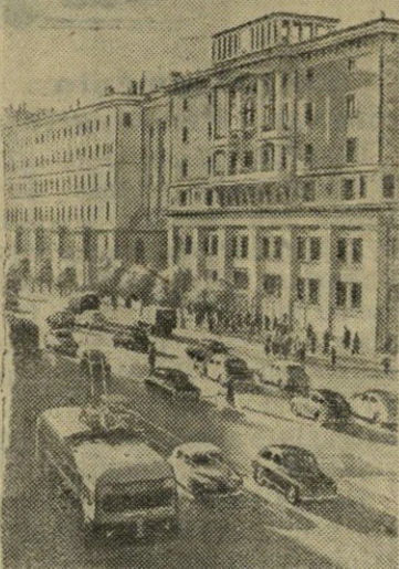
MASKVA ŠIANDIEN. Gorkio gatvė.