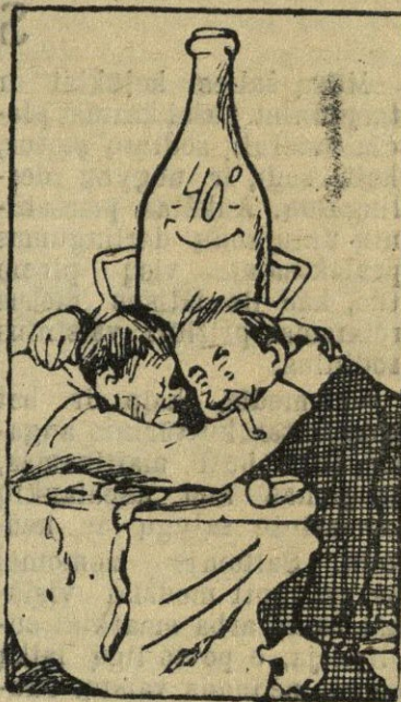
Dėl pašarų susitarta...