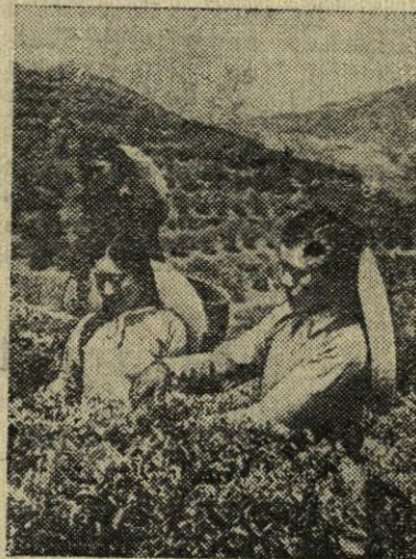
Kinijos Liaudies Respublika. Arbatos plantacijos Chančou miesto rajone.

* 1951 metais VDR buvo 25 tūkstančiai studentų. Dabar jų skaičius išaugo iki 74 tūkstančių. Pusę studentų sudaro darbininkų ir valstiečių vaikai.