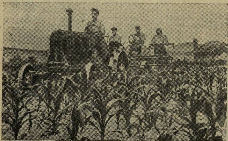
Korėjos Liaudies Demokratinė Respublika. Pchenjano MTS mechanizatoriai nuima gaoliano derlių.