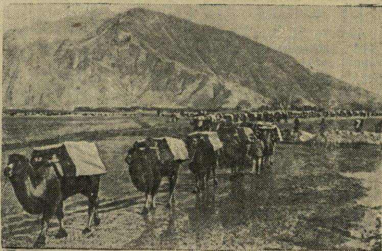
Kinijos Liaudies Respublikos vyriausybė didelį dėmesį skiria Tibeto gyventojų sveikatos apsaugai. Nuotraukoje: karavanas su medikamentais, vykstantis į Tibetą.

įžengusius į Diu teritoriją. Savanoriai buvo suimti ir išvežti į Diu miestą. Prieš suimdamą, policija žiauriai sumušė savanorius. (ELTA).