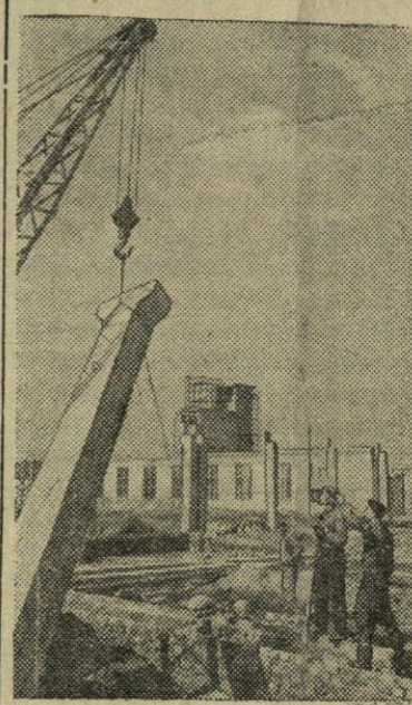
Vilniaus miesto pakraštyje statoma betono gamykla, kuri gamins gelž- betoninius perdenginius ir betoną. Čia baigiamos statyti pagrindinės ir pagalbinės patalpos, įrengiama estakada, montuojamos surenkamo- sios gelžbetoninės kolonos. Nu o- t r a u k o j e: surenkamųjų gelž- betoninių kolonų montavimas.

Naujos politinės mokyk- los steigiamos „Pašilės“ ir Stalino vardo kolūkiuose,