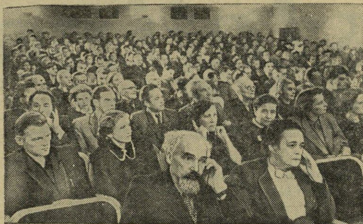
Lietuvos TSR Tarybinių rašytojų sąjungos II suvažiavimo posėdžių salėje.

Kolūkyje dirbančią traktorinę brigadą vadovauja brigadininkas P. Makštelė. Brigados traktorininkai, jausdami nuolatinį vadovavimą, kaskart spartina sėjos tempus. V. SPIGLINSKAS