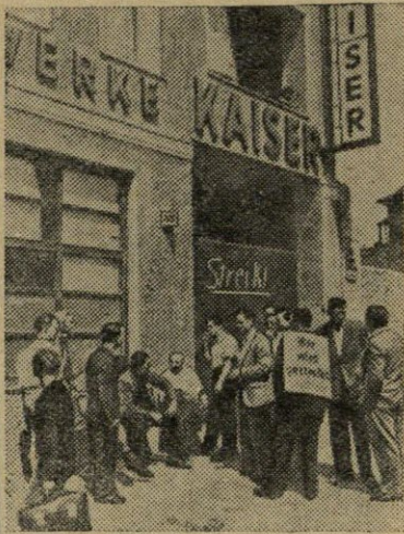
Vakarų Berlyno dirbantieji kovo- ja už darbo užmokesčio pakėlimą. Eilėje Vakarų Berlyno metalo ap- dirbimo pramonės įmonių vyko streikai. Nuotraukoje: streikuojančiųjų piketai prie Kai- zerio motorų gamybos fabriko.

Aukščiausiasis teismas nuteisė Štepaną Trochtą kalėti 25 metus, Františką Rabasą — 20 metų, Franti- šką Vlčeką — 15 metų ir Bogumilą Landsmaną — 7 metus kalėti konfiskuojant turtą ir atimant pilietines teises. (ELTA).