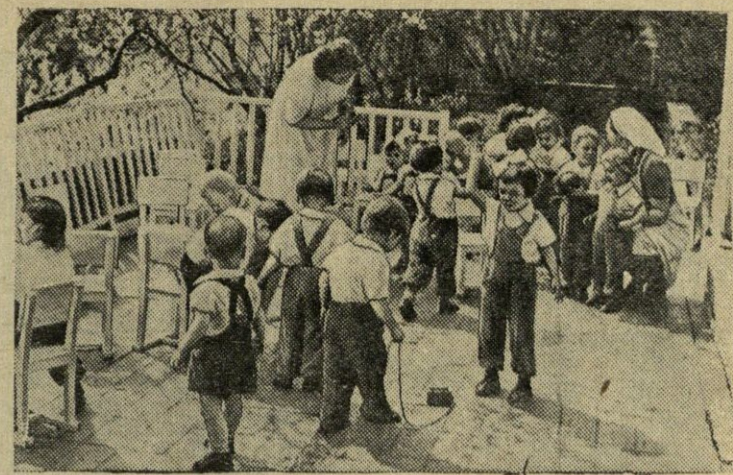
Čekoslovakijos Respublikos vyriausybė didžiai rūpinasi vaikais. Dėl jų statomos patogios ir erdvios mokyklos, vaikų darželiai, lopšeliai. N u o t r a u k o j e: Bratislavos vaikų darželio vėrandyje

Kiek toli nuėjo ši savotiška spalvų baimės liga, galima spręsti iš sekančio fakto.