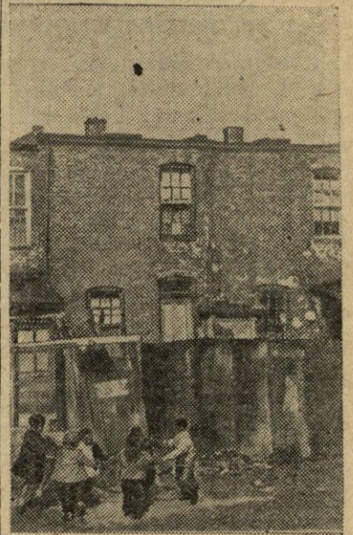
Sunkus negrų vaikų gyvenimas Jungtinėse Amerikos Valstybėse. Jų tėvai dažnai neturi darbo, ir vaikams neretai tenka badauti. Žaisti su baltųjų vaikais negalima. Bet koks baltasis gali juos paniekinėti, mesti į veidą žodį „tamsiaodis“. Negrai gyvena pašiurėse, izoliuotose miesto kvartaluose. Ši nuotrauka, parodanti negrų vaikus prie vargingos lašnos Vašingtono miesto, buvo atspausdinta amerikiečių žurnale „Saterdei evening post“.