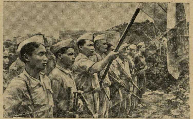
Patet Lao—viena iš trijų Indokinijos demokratių respublikų. Didvyriškos kovos už taiką ir šalies nepriklausomybę procese pasipriešinimo vyriausybę sudarė Patet Lao Liaudies išsivaduojamąją armiją. Nuotraukoje: Patet Lao Liaudies išsivaduojamosios armijos barys.