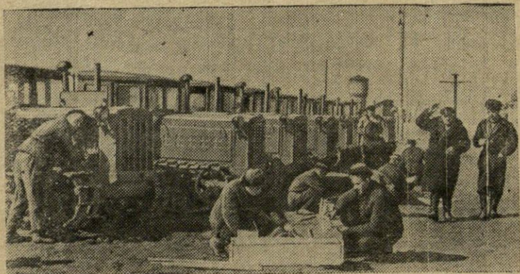
ALTAJAUS KRAŠTAS. Neseniai organizuotą Kulundino grūdų tarybinę aikštį prisiūnčiama nauja technika. Nuotraukoje: Kulundino grūdų tarybinio ūkio mechanizatoriai gauna eilinę traktorių partiją Kulundo geležinkelio stotyje.