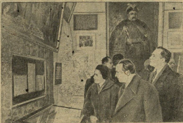
Perejeslavo — Chmelnickio miestą aplankė grupė mokslininkų — Ukrainos TSR Mokslų akademijos jubiliejinės sesijos, pašvęstos Ukrainos susijungimo su Rusija 300-osioms metinėms, dalyvių. Svečiai susipažino su istorinėmis miesto įžymybėmis. Nuotraukoje: sesijos dalyviai — Maskvos, Talino ir Kijevo mokslininkai Perejeslavo-Chmelnickio istoriniame muziejuje susipažįsta su Bogdano-Chmelnickio dokumentais.

J. KVIETKAUSKAS Kolūki šefuojančios organizacijos atstovas