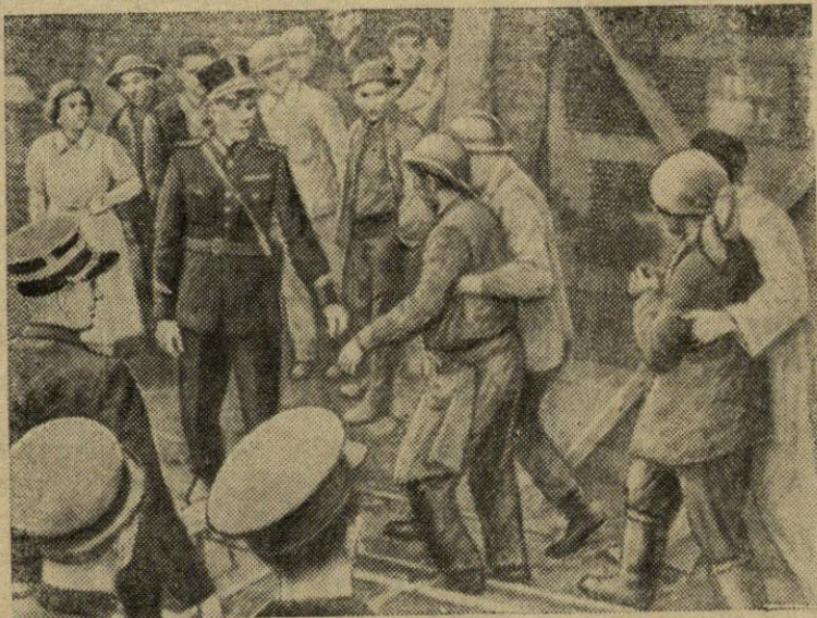
Belgų šachtų savininkai nesirūpina darbo apsauga. Dėl apsaugos technikos blogos būklės neretai įvyksta katastrofos su žmonių aukomis. Neseniai vienoje Sereno rajono šachtoje įvyko sprogimas. Buvo sužeista ir užmušta daug šachtininkų.

Riazanės srities Rybnos rajono Stalino vardo kolūkio brigadininkas