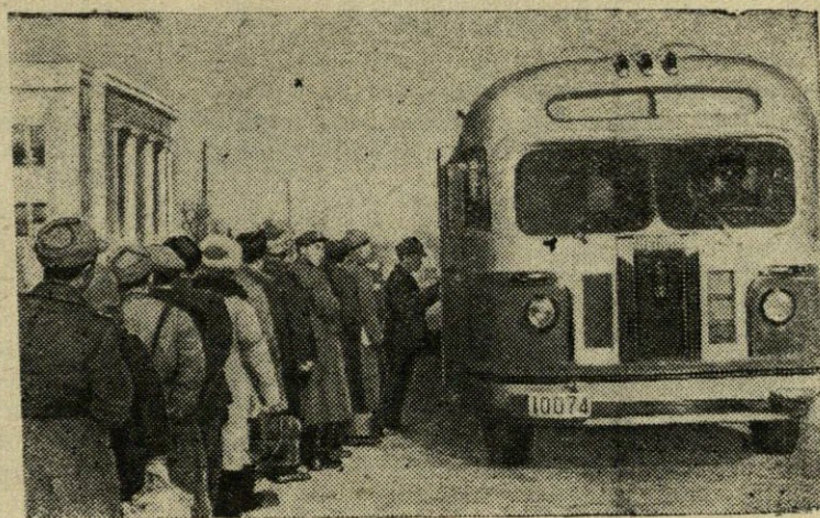
PCHENJANAS. Korėjos Liaudies Demokratinės Respublikos sostinės gatvėmis kursuoja autobusai „ZIS-155“, gauti iš Tarybų Sąjungos. Nuotraukoje: autobusų sustojimo vietoje. (TASS).