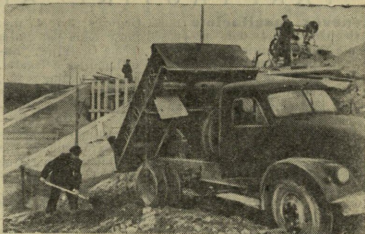
Sedos rajone penkių žemės ūkio artelių kolūkiečiai stato prie Vardavos upės 280 kilovatų pajėgumo hidroelektrinę. Statyboje dirba galinga tėvyninė technika—ekskavatoriai, buldozeriai, skreperiai, savivarčiai sunkvežimiai ir kiti mechanizmai. Nuotraukoje: Renavos tarpkolūkinės hidroelektrinės statyba.