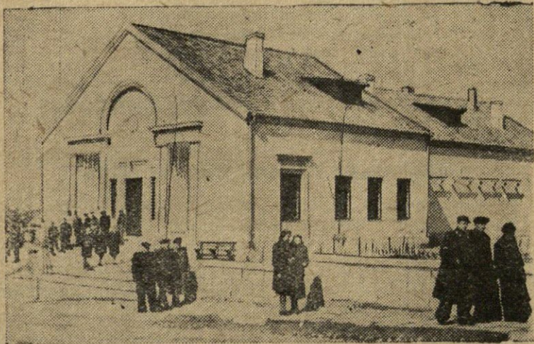
Naujas kino teatras Salantų rajono centre su 200 vietų žiurovų sale.