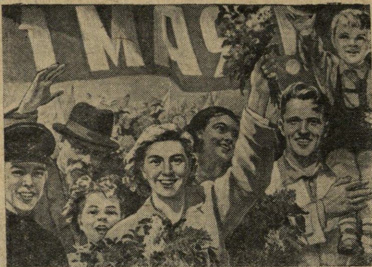
Dailininko N. Vatolino darbo plakatas (Valstybinė vaizduojamojo meno leidykla).