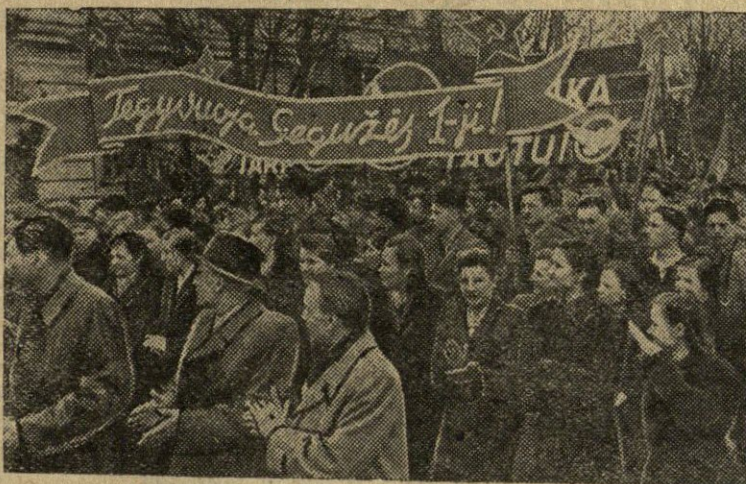
Vilniaus miesto darbo žmonių demonstracija 1954 m. gegužės 1 d. Nuotraukoje: Stalino rajono demonstrantų kolona žen- gia Stalino prospektu.