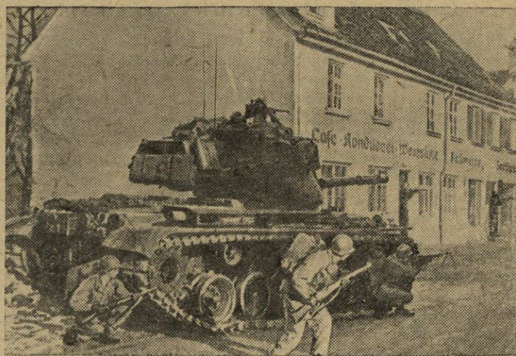
Amerikietiškas žurnalas „Nju Jork taimes megezin“ patalpino šią nuotrauką su sekančio turinio tekstu:

„Okupacija. Dominuojančiu faktu Vakarų Vokietijos sąlygomis yra tai, kad užsienio okupacinės karinės dalys pasilieka šalyje. Kancleris Adenaueris pareiškė, kad jo šalis už saugumą dėkinga Vakarų Vokietijoje esančioms amerikiečių karinėms pajėgoms. Aukščiau minėta kariuomenė manevruose“.