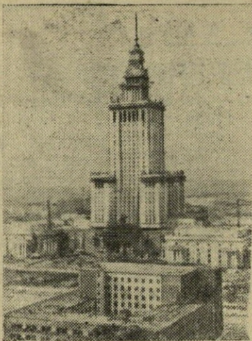
Virš atgimstančios Varšuvos išdidžiai iškyla J. V. Stalino vardo kultūros ir mokslo rūmai — Tarybų Sąjungos liaudies dovana Lenkijos Liaudies Respublikai. Dabar vykdomi rūmų apdailos ir architektūrinių detalių statymo darbai.