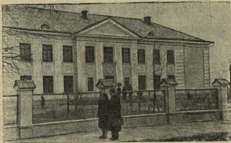
Anykščiuų rajono centre nuo mokslo metų pradžios atiduoata eksploatacijai vidurinė mokykla, kuri pavadinta lietuvių rašytojo Jono Biliūno vardu. Nuo o t r a u k o j e : naujos J. Biliūno vardo vidurinės mokyklos Anykščiuose bendras vaizdas.