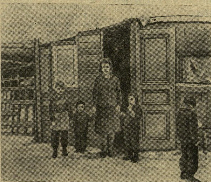
Butų klausimas Prancūzijoje tebėra nepaprastai aštrus. Takstančiai benamių prancūzų dieną nežino, kur jie praleis naktį. Šiais metais žiema Europoje buvo nepaprastai atšalusi. Prancūzų laikraščiai praneša, kad, esant stipriems šalčiams, sušalo nakvojusieji gatvėse vaikai ir suaugusieji. Žurnalas „Parti-matė“ patalpino keletą nuotraukų, liudijančių apie baisingą butų sąlygas, kuriuose tačiau gyvena daugelio prancūzų šeimos. N u o t r a u k o j e : šitame ant greitųjų sukaltime barake gyvena didelė šeima.