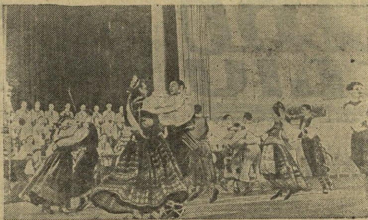
Lietuvių literatūros ir meno dekada Maskvoje. Lietuvos TSR Valskybinio liaudies dainų ir šokių ansamblio koncertas P. I. Čaikovskio vardo Koncertų salėje.