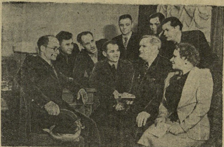
MASKVA. Gamyklos „Serp i molot“ klube įvyko vakaras, skirtas lietuvių literatūrai ir menui. Nuotraukoje: dekadės dalyviai kalbasi su gamyklos metalurgais.