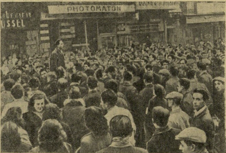
PRANCŪZIJA. Visoje šalyje vyksta darbo žmonių mitingai ir demonstracijos, nukreipti prieš Paryžiaus ir Bonos karinius susitarimus. Prancūzai pasisako prieš „Europos armijos“ sudarymą, jie nenori būti patrankų mėsos kare, kurį ruošia amerikiniai imperialistai. Nuotraukoje: prancūzų dirbančiųjų mitingas Marselio mieste.