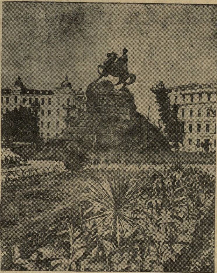
Ukrainos susijungimo su Rusija 300-osioms metinėms Paminklas ižymiajam ukrainiečių valstybės veikėjui ir karvedžiui Bogdanui Chmelnickiui.

Kandidatų į deputatus tarpe mes matome taip pat priešakinius socialistinės žemdirbystės pirmūnus. Kolūkinio kaimo žmonių rinkimas į aukščiausiąją šalies valdymo organą visų pirma primena tai, kad Lietuvos valstietis, visiems laikams išsivadavęs iš buožių jungo, yra pilnateisis savo krašto šeimininkas, naujo pasiturimo kolūkinio gyvenimo statytojas. Išaugo puikūs kolūkinės gamybos pirmūnai, rodantieji paslaukojamo darbo pavyzdžius kovoje už maisto produktų gausumo sukūrimą mūsų šalyje, už TSKP CK rug-