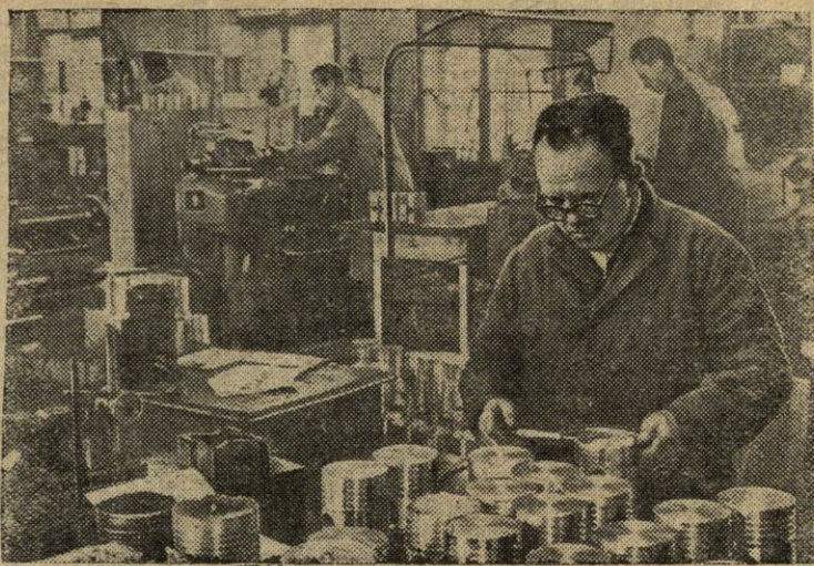
ČEKOSLOVAKIJOS RESPUBLIKA. Karlovo srities MTS remonto dirbtuvės Slatonoje užbaigs traktorių remontą iki pavasario lauko darbų pradžios. Dirbtuvės taip pat gamina atsargines dalis traktorių variklams. Nuotraukoje: atsarginių dalių traktorių variklams išleidimo ceche.

MAR-DEL-PLATA (TASS). Čia prasidėjo tarptautinis kino festivalis, kuriame dalyvauja 19 šalių, jų tarpe TSRS, Lenkija, Vengrija, Bulgarija ir Čekoslovakija. (ELTA).