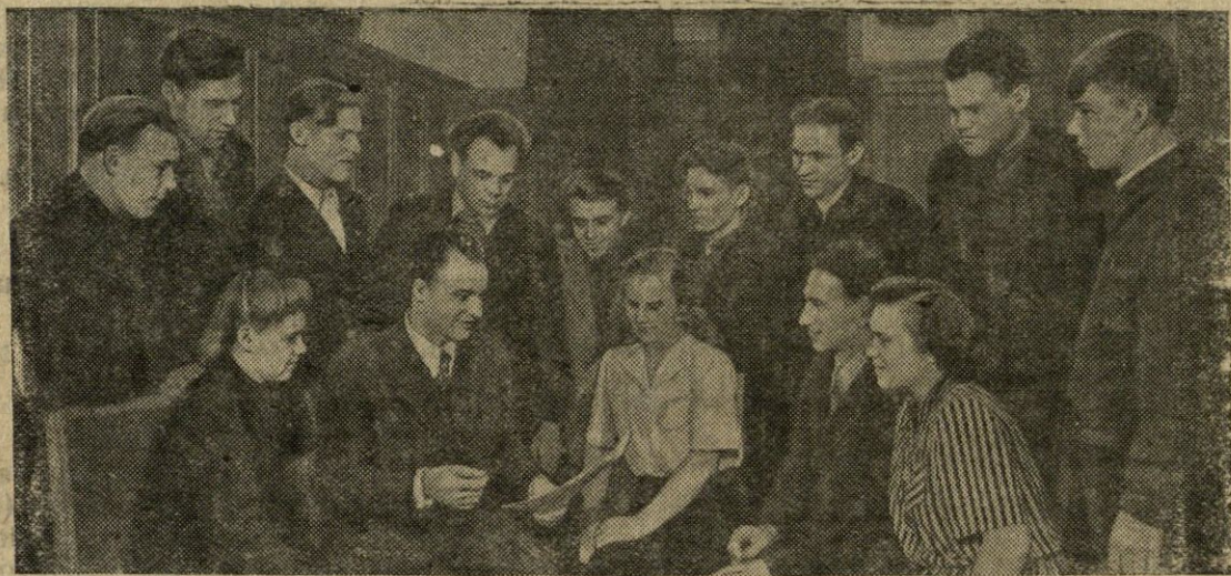
Grupė Maskvos Stalino vardo automašinių gamyklos darbininkų, siekdami savo darbu prisidėti prie socialistinio žemės ūkio tolesnio pakėlimo, pareiškė norą važiuoti dirbti į dirvonų ir plėšinių išsavinimo rajonus. Nuo kairės: grupė Maskvos Stalino vardo automašinių gamyklos darbininkų ir specialistų, išvažiuojančių į naujų žemių išsavinimo rajonus. (TASS).

jų skaičiumi. Kiekvienas kandidatas renkamas tik vienoje apygardoje.