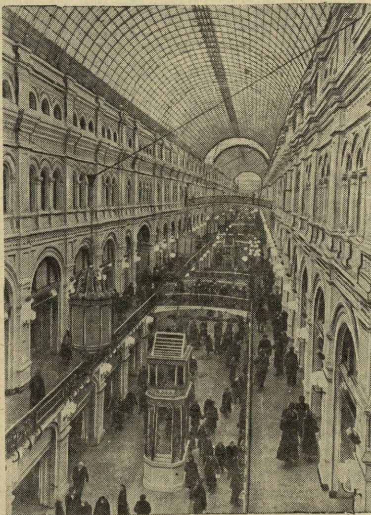
Neseniai viename iš gražiausių sostinės pastatų buvo atidaryta stambiausioji šalyje Valstybinė universalinė parduotuvė [GUM]. Nuotraukoje: Valstybinės universalinės parduotuvės vidinis vaizdas.