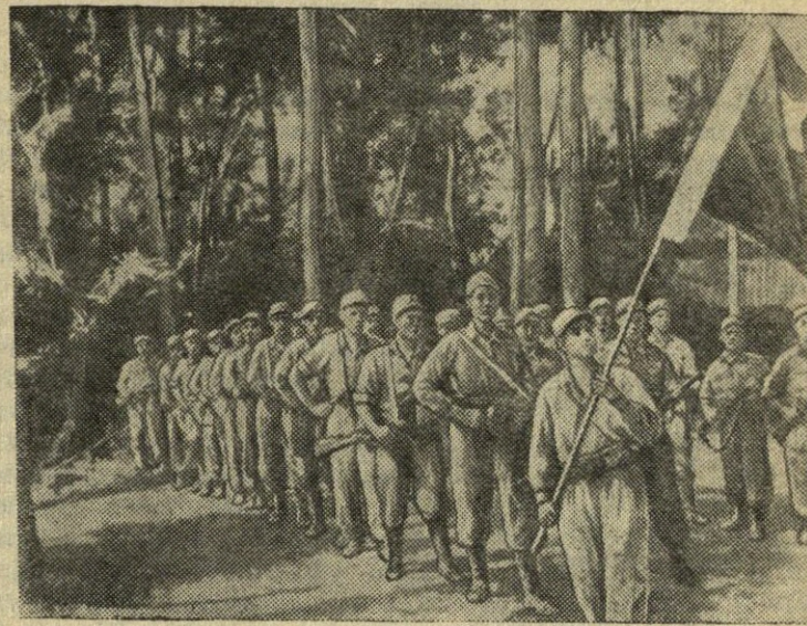
Malajiečių liaudis didvyriškai kovoja už savo tėvynės laisvę ir nepriklausomybę. Tvirtėja Malajų Nacionalinės išsivadujamosios armijos kovotojų eilės, auga jų karinis meistriškumas. Nuotraukojė: Malajiečių Nacionalinės išsivadujamosios armijos karinė dalis.