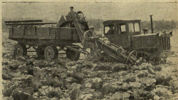
Kopūstų nuėmimo mašina „PKN-1“.