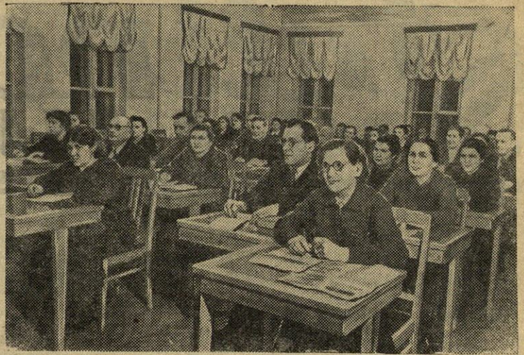
BRIANSKO SR TIS. TSKP Bežickio miesto komitetas į pagalbą studijuojantiems marksizmo-leninizmo pagrindus suorganizavo lektoriumus, kurie veikia prie mokytojų namų, Briansko garvežių statybos fabriko kultūros namų ir plieno liejyklos. Virš 400 žmonių yra nuolatiniai lektorių klausytojai. Nuotraukoje: pamokoje savistoviai studijuojantiems TSKP istoriją.