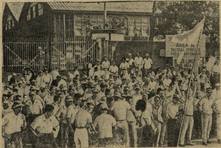
Japonijos darbininkai veda atkaklią kovą už savo teises. Dirbantieji ištvoja prieš šalies militarizavimą, prieš antilaudinę vyriausybės politiką, prieš amerikiečių kariuomenės vykdomą japonijos okupaciją. Neseniai japonų darbininkai, dirbantieji amerikinėse karinėse bazėse, paskelbė visuotinį 48 valandų streiką, protestuodami prieš blogas darbo sąlygas. Streikavo apie 150 tūkstančių žmonių. N u o t r a u k o j e : streikuojančiųjų piketai prie amerikinio karinio sandėlio Tokio mieste.