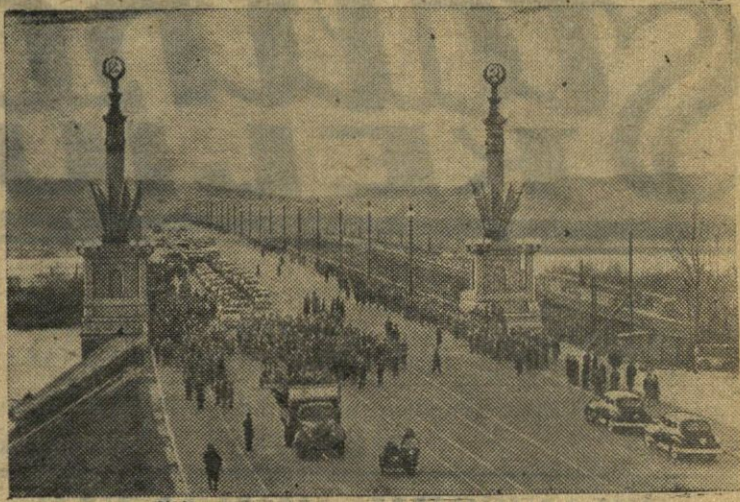
Kijeve iškilmingai atidarytas ištisinės metalinės konstrukcijos tiltas per Dnieprą. Jis suungė Tarybų Ukrainos sostinės centrinę dalį su stambiausiu miesto pramoniniu rajonu — Darnice. Nuotraukoje: tilto vaizdas iš Darnicės pusės. (TASS).