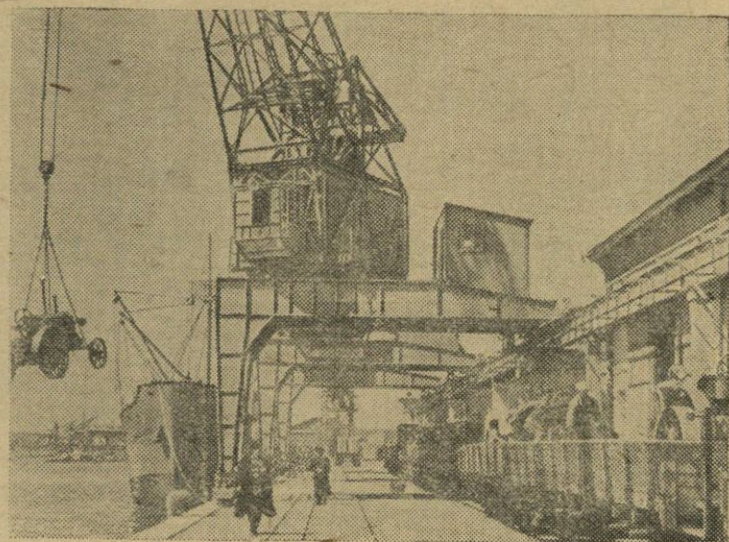
Bulgarijos Liaudies Respublika. Iškovimas Stalino miesto uoste traktorių, prisiųstų iš Tarybų Sąjungos.

Yra žinoma, kad Benua Frašonui ir kitiems demokratinėse organizacijose vadovams buvo pateiktas tas pats kaltinimas „pasikėsimu į valstybės išorinį saugumą“, kuris buvo pateiktas deputatams-komunistams. (ELTA).