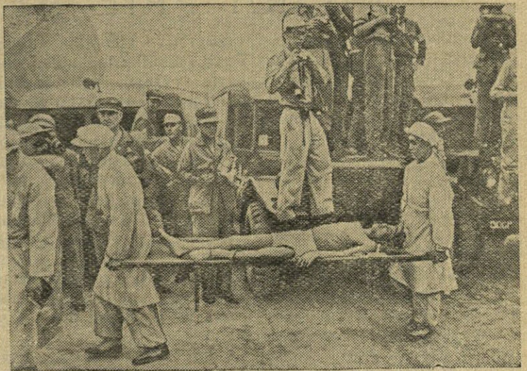
ŠIAURĖS KORĖJA. Korėjos Liaudies Demokratinės Respublikos Liaudies armijos kariai ir kinų liaudies savanoriai, grįžę iš nelaisvės, kaltina amerikiečius žiauriai elgusius su belaisviais karo belaisvių stovyklose. Prieš karo belaisvius buvo vartojamos nuodingos medžiagos, jie buvo verčiami daugelį valandų dirbti be poilsio, sergantiesiems ir sužeistiems nebuvo teikiama medicininė pagalba. Dėl nedavalgymo ir avitaminozės karo belaisvių tarpe išplito įvairios ligos. N u o t r a u k o j e: Kesone korėjiečių sanitarai išneša iš amerikiečių sunkvežimio sergantį karo belaisvį, kuris dėl sistemingo nedavalgymo karo belaisvių stovyklose neteko galimumo vaikščioti.