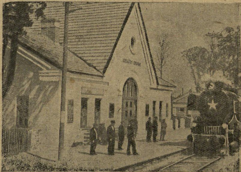
Nuotraukoje: nauja geležinkelio stotis Subačiauje („Pirmūno“ kolūkio centre).

Mūsų kolūkis tapo stiprus išaugus kolūkiečių sąmoningumui ir aktyvumui. Kolūkiečiai aukščiau stato žemės ūkio artelės reikalus už savo asmeninius. Vaisingai dirbdami bet kuriame kolūkinės gamybos bare, nuolat keldami darbo našumą, žemdirbiai kiekvienas įdeda savo indėlį į kolūkio stiprinimą ūkinio-organizacinio atžvilgiais. Švęsdami Tarybų Lietuvos XIII-sias metines, kolūkiečiai pasižada negailėti savo jėgų kovai už tolimesnę socialistinės Tėvynės galios stiprinimą.