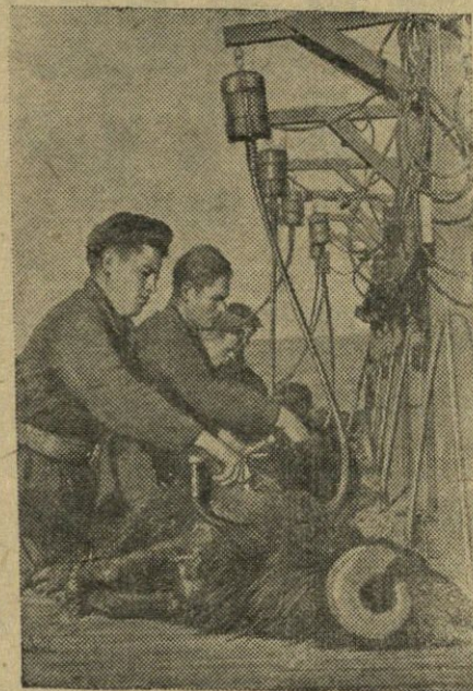
ODESOS SRITIS. Bie-liajevskio rajono „Šlia-chom Lenta“ kolūkyje sėkmingai vykdomas avių kirpimas.

Komunistus politiškai auk-lėja ne tik knygos, partinio švietimo tinklo rateliai bei politinės mokyklos, bet ir praktinio darbo savo parti-nėje organizacijoje procesas. Dirbdamas vienoje iš parti-jos organizacijų, komunistas privalo vykdyti įvairius pir-minės partinės organizacijos