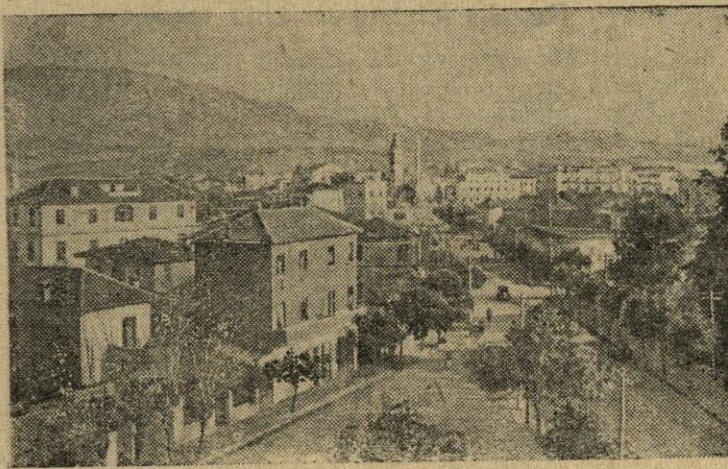
Albanijos Liaudies Respublikos sostinė Tirana.

Šiaulių srities Profesinių sąjungų tarybos plenumo narys