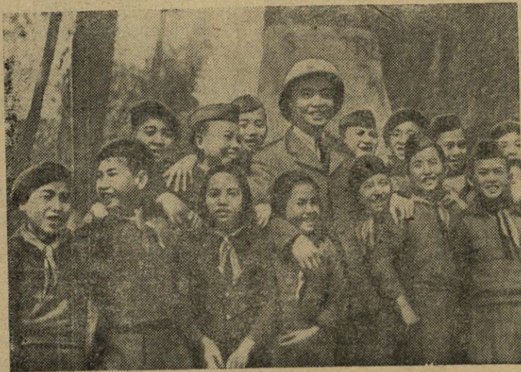
Liaudies armijos išvadotojai nuo prancūziškųjų okupantų Vietnamo teritorijoje įsteigta daug mokyklų. Vaikai myli Liaudies armiją, atnešusią jiems laimingą ir džiugų gyvenimą.

Be to, piliečiai, pradėję verstis amatų verslu, privalo paduoti deklaracijas. Už nepadavimą ar netikrų žinių suteikimą bus baudžiami pinigine bauda. Kortelės „F. Nr. 2“ pristatyti iki 1953 m. birželio mėn. 23 d. Už pavėluotą ar netikrų žinių suteikimą namų valdytojai ar namų savininkai bus baudžiami pinigine bauda.