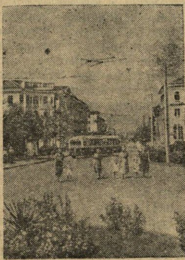
Sevastopolis. Komunos aikštėje.