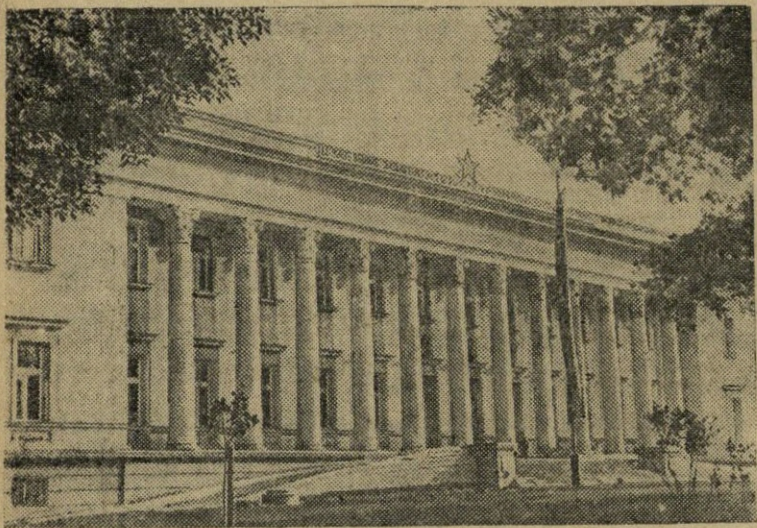
Bulgarijos Liaudies Respublika. Respublikos sostinėje Sofijoje išsiplėtė didelė gyvenamųjų pastatų statyba. Šiais metais čia statoma apie 400 gyvenamųjų namų ir 57 visuomeniniai ir administraciniai pastatai.

Nuotraukoje: naujas V. Kolasovo vardo valstybinės viešosios bibliotekos pastatas Sofijoje. (TASS).