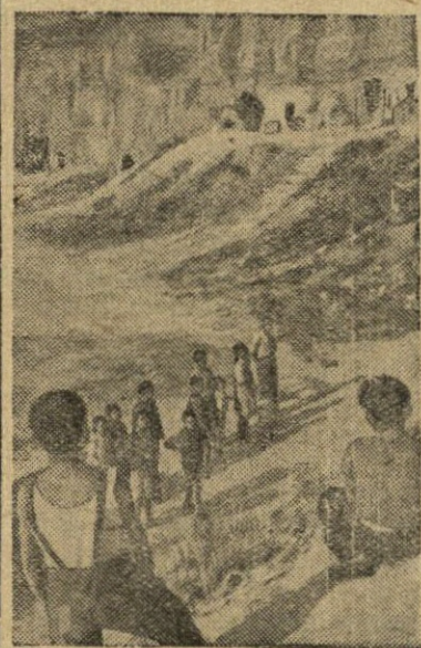
Frankistinėje Ispanijoje dešimties tūkstančių darbo žmonių atimtas galimumas gyventi, jie neturi pastogės.

Nuotraukoje: darbo žmonių vaikai prie savo urvinių gyvenviečių.