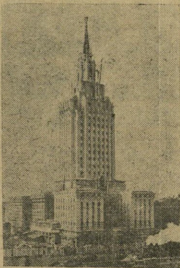
MASKVA. Viešbučio daugiaaukščio pastato statyba Kalcevskaja gatvėje.

Kolūkio partinių organizacijų pagrindinis uždavinys — nepaliaujamai gerinti partinį darbą kaime. Reikalinga plačiai aiškinti kolūkiečiams partijos XIX suvažiavimo nutarimus ir įtraukti kolūkių narius į aktyvų dalyvavimą vykdančią gamybines užduotis.