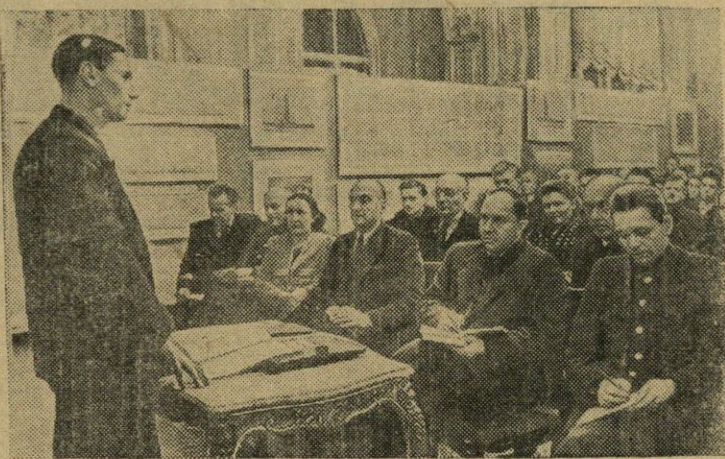
LENINGRADAS. Leningradiečiai su didžiuoju susidomėjimu studijuoja genialų J. V. Stalino veikalo „Ekonominės socializmo TSR Sąjungoje problemos“.