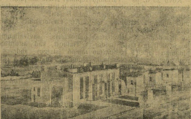
Tarpkolūkinės hidroelektrinės „Mickūnai“ projektas.