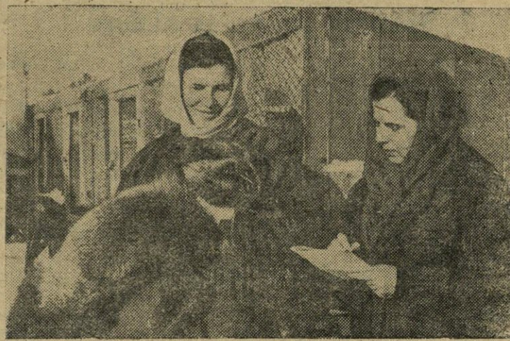
Gražioje vietoje Nemuno krante yra žvėrių auginimo tarybinis ūkis „Vilkija“. Jo fermose yra šimtai sidabrinių lapų. Šiais metais jų skatėms padidėjo 250 motininių lapų. Šiais metais sukurtos naujos sidabrinių lapų fermos.