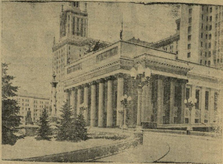
Maskva. Daugiaaukštis Maskvos Valstybinio universiteto pastatas Lenino kalnuose. Nuotraukoje: svarbiausias įėjimas.