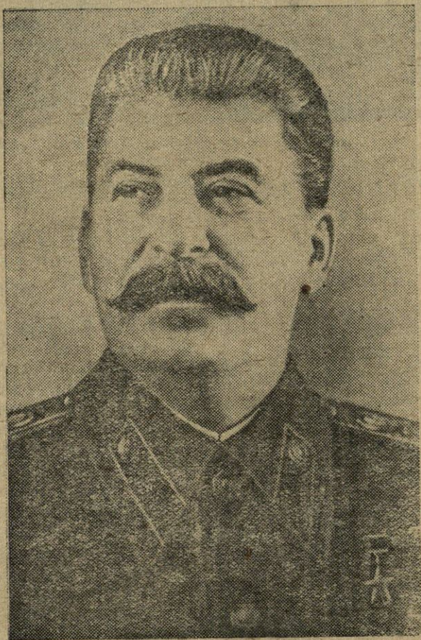
J. V. STALINAS

LKP Kupiškio rajono komiteto ir rajono Darbo žmonių deputatų tarybos organas