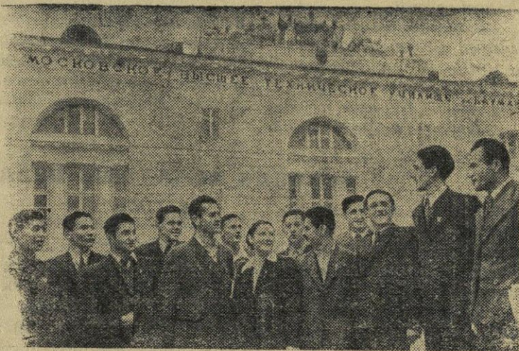
Maskvos Baumano vardo aukštojoje technikum mokykloje mokosi 35-kių tautybių studentai.