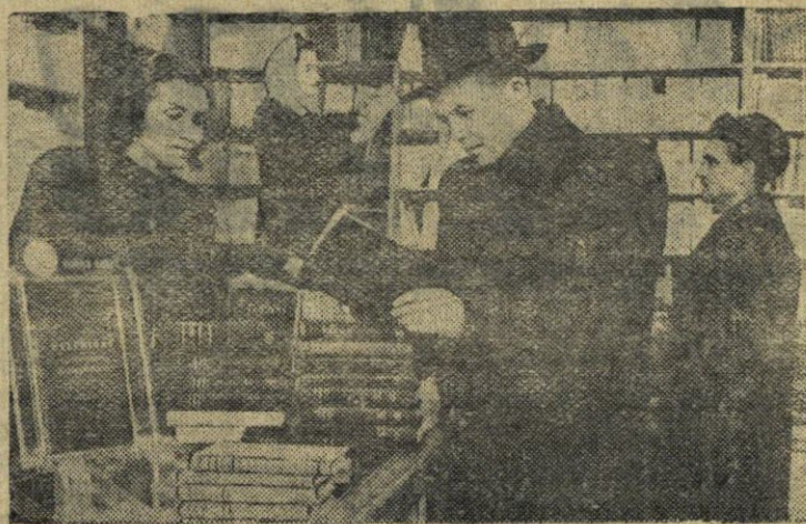
Ryštum su lenininėmis dienomis Vilniaus miesto knygynuose padidėjo nemirtingųjų didžiojo darbo žmonių vado ir mokytojo V. I. Lenino veikalų paklausa.