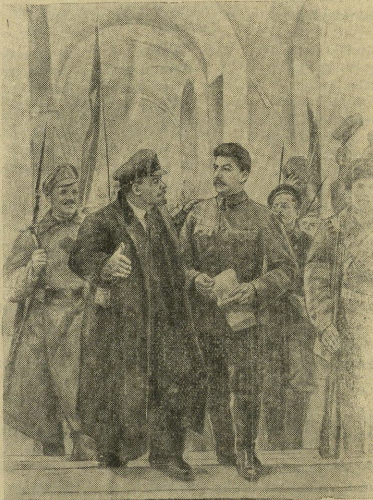
35 METAI ATGAL