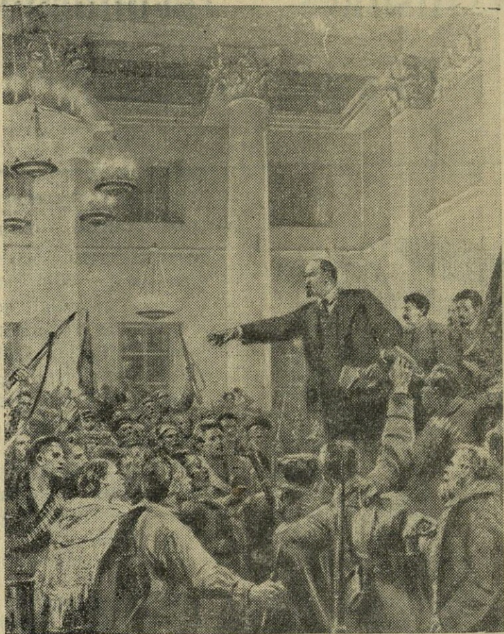
35 METAI ATGAL