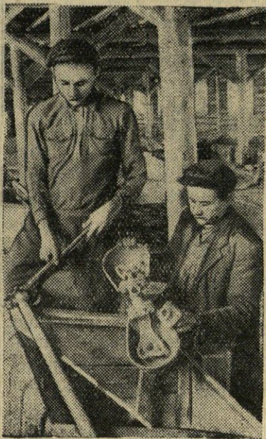
Ukmergės rajono „Lenino keliu“ kolūkis rengia šiltą žiemą žemumėnams gyvuliams. Jau pastatytos karvidė, kiaulidė, statoma arklidė. Didelę pagalbą teikia kolūkiui Deltuvos MTS.

Kupiškio rajono kultūros - švietimo darbo skyriaus vedėjas