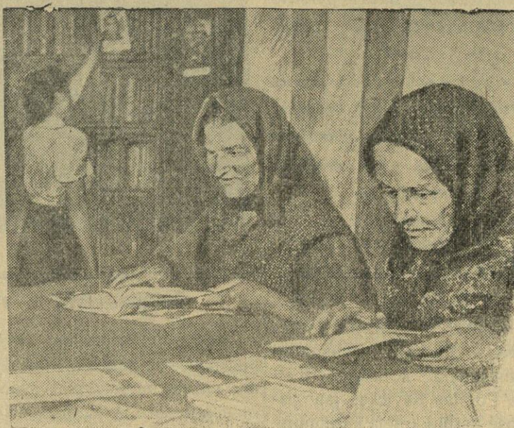
Vengrijos Liaudies Respublikoje kiekvieną dieną didėja bibliotekų skaičius miestuose ir kaimuose. Neseniai Senchalomo kaime atidaryta tritūkstantinė liaudies biblioteka. Nuotraukoje: Rakocio vardo žemės apdirbimo kooperatyvo nariai naujoje bibliotekoje.