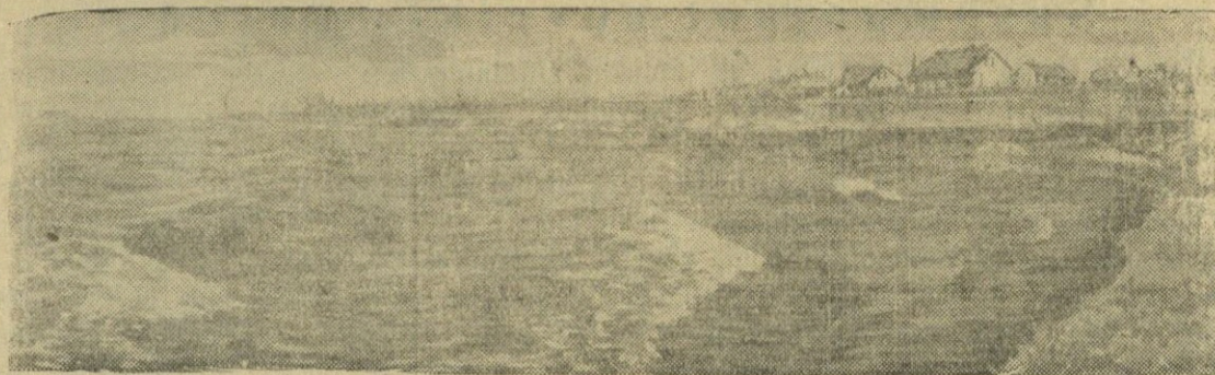
Volgodonstrojus. Karpovskos vandens saugykla. Dešinėje — Iljevkos gyvenvietė.