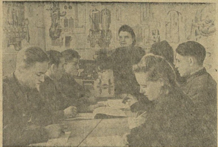
Svenčionių MTS traktorininkų kursų baigė 52 žmonės. Nuotraukoje: grupė būsimųjų traktorininkų ruošiasi išleidžiamiesiems egzaminams.