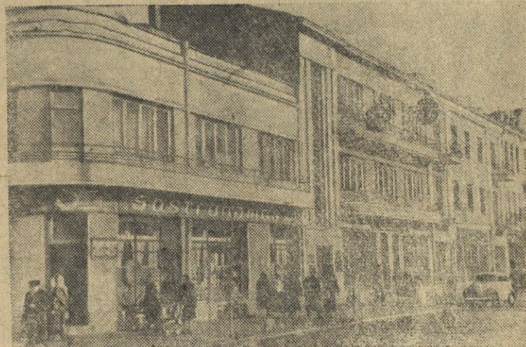
Nuotraukoje: Šiaulių miestas, Vilniaus gatvė. Priešakyje - nauja parduotuvė.