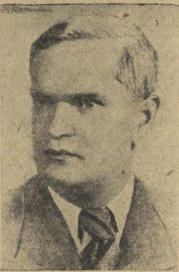
Stalininės premijos laureatas poetas A. VENCLOVA

Lietuvos TSR Valstybinio dramos teatro kolektyvas statė „Neužmirštamuosius 1919-uosius“ bedradarbiaudamas su Maskvos Mažuoju akademiniu teatru. Teatro kolektyvas, ruošdamasis nepaprastai atsakingam