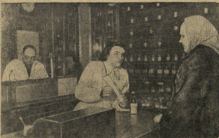
Šiaulių srities Dotnuvos rajono „Aušros“ sustambintame kolūkyje veikia ligoninė, ambulatorija, vaistinė, gimdymo namai.